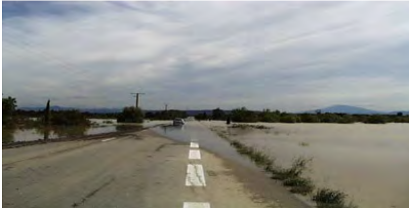
Inondation d'une route près de Rochedgude

Le débordement indirect d'un cours d'eau peut se produire: par remontée de l'eau dans les réseaux d'assainissement ou eaux pluviales ; par remontée de nappes alluviales ; par la rupture d'un système d'endiguement ou autres ouvrages de protection.