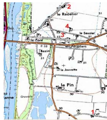
Plan de situation des 4 repères de crues