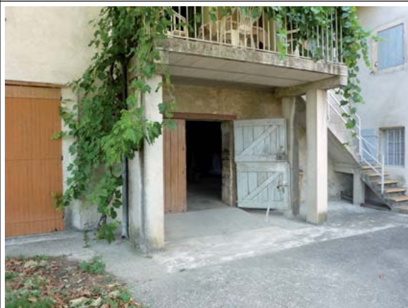
Repère n°4 : quartier Robinson, ferme de la Calmette