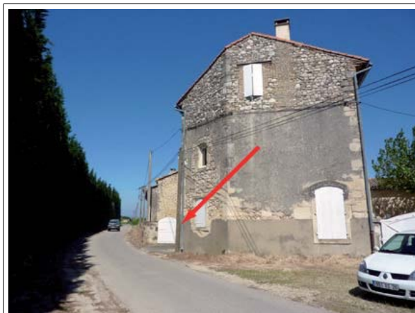
Repère n°2 : chemin du Radelier, sur l'angle d'un mur