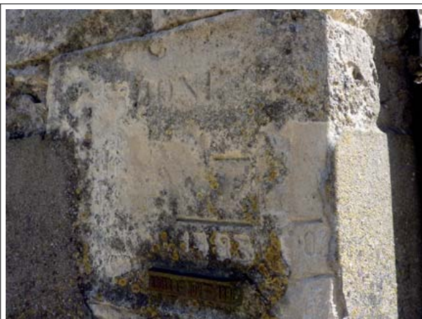
1856 gravé dans la pierre - 1993 gravé dans la pierre 2003 gravé dans la pierre - 1994 gravé dans la pierre 1er novembre 1896 barre métallique