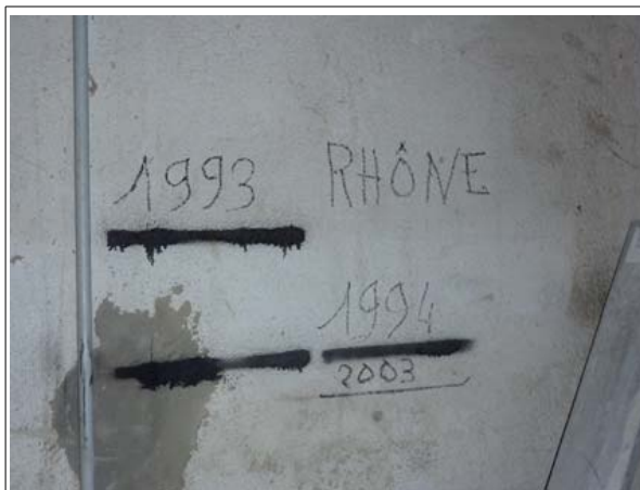
Repère n°3 : chemin de la Calmette, sur le mur d'un garage