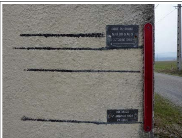
janvier 2003 repère peint - 7 janv. 1994 plaque métallique novembre 2002 repère peint - 9 oct. 1993 plaque métallique