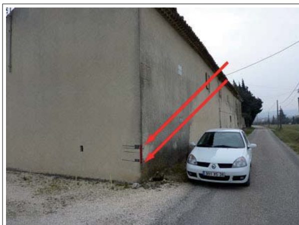
Repère n°1 : quartier les Perrotines, sur le mur d'une maison

Le recensement des repères de crue effectué par l'Établissement Public Territorial de Bassin 8 (EPTB Territoire Rhône) en 2010, permet de localiser 4 repères sur la commune de Pierrelatte.