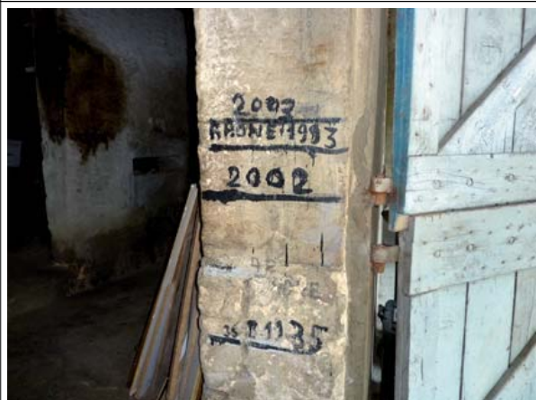
1993 repère peint - 2002 repère peint 2003 repère peint - 1935 repère peint