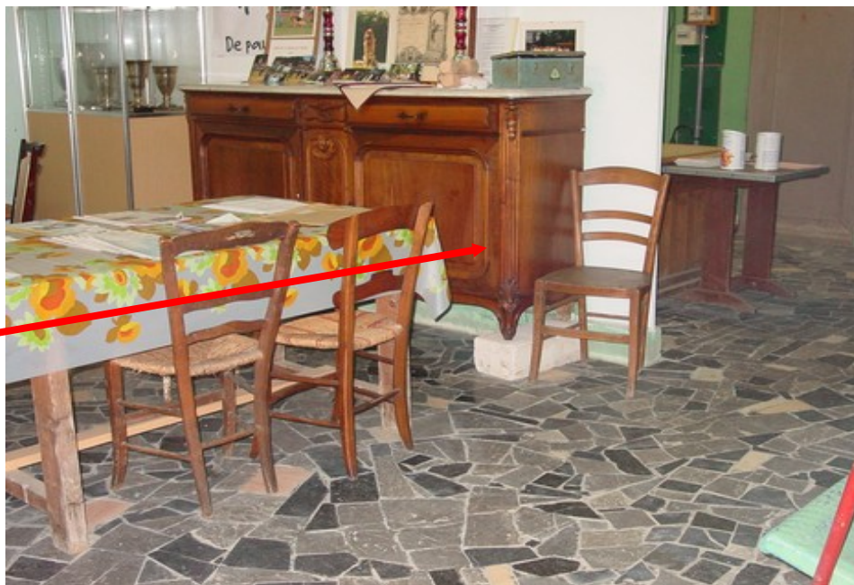
Photo prise chez des riverains de l'Ousse des Bois

Si l'on compare les débits estimés de ces crues historiques aux débits caractéristiques statistiques, les crues de 1875 et 1889 auraient une période de retour d'environ 100 ans, et la crue de 1952 une période de retour de 30 ans environ. Cette remarque est importante car la comparaison des niveaux atteints par la crue de 1952 observés à l'époque et ceux obtenus par le calcul de ligne d'eau sur le secteur d'étude en fréquence centennale dans l'état actuel, montre que l'approfondissement du lit mineur du Gave de Pau permet d'évacuer une crue de fréquence centennale à un niveau beaucoup plus bas que celui observé en 1952 (fréquence trentennale).