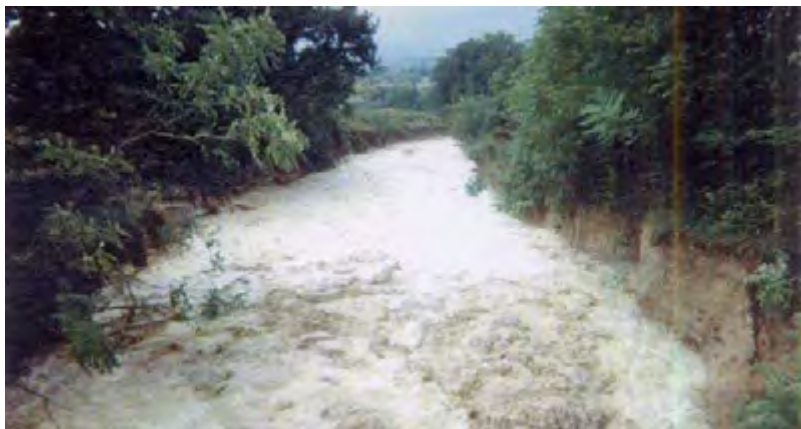
Le Grand Vallat (1993). Commune de Valréas

Ce type de phénomène se retrouve par ailleurs dans les vallats (ou talwegs).