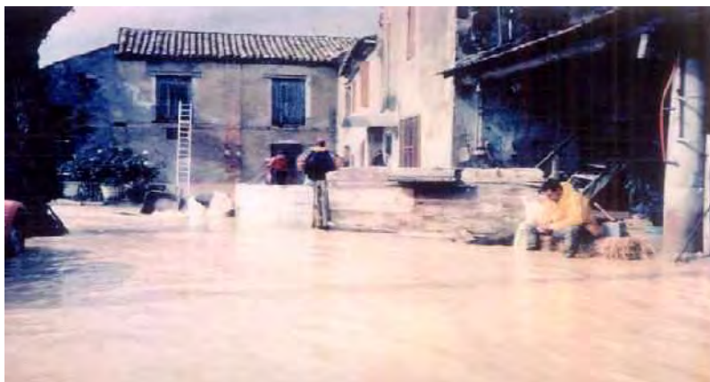
Inondation d'une exploitation agricole sur la commune de Visan.

Ce type d'inondation n'est, en général, pas dangereux pour la vie humaine, mais peut engendrer des dégâts matériels lourds.