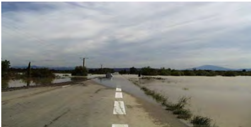
Inondation d'une route près de Rochedgude

Le débordement indirect d'un cours d'eau peut se produire: par remontée de l'eau dans les réseaux d'assainissement ou eaux pluviales ; par remontée de nappes alluviales ; par la rupture d'un système d'endiguement ou autres ouvrages de protection.